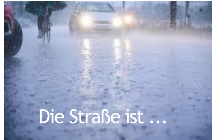
Die Straße ist ...